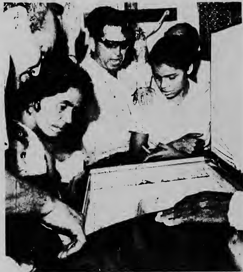
MANAGUA, NICARAGUA--Algun hende ta mirando cadaver di e ex-presidente nicaraguense General Emiliano Chamorro cu a muri dia 26 di februari di un ataque di curazon na edad di 95 aña. E tabata e lider politico di mas bieuw na mundu.

Tantu pa terra como pa laman yudanza ta bini pa e pueblonan